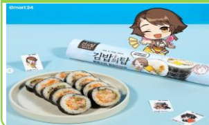
이마트24 X 넷마블