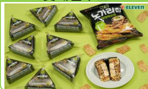
세븐일레븐 X 롯데웰푸드