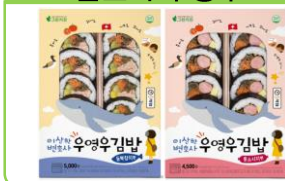
세븐일레븐 X 이상한 변호사 우영우